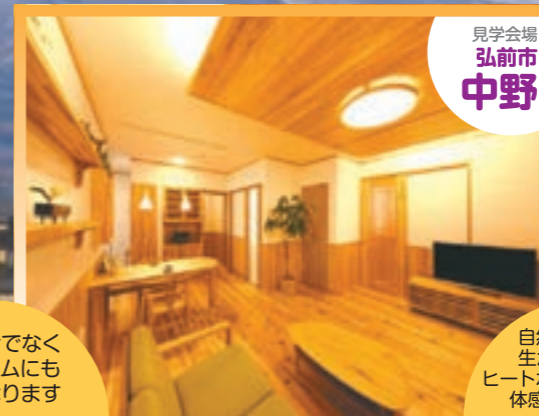
見学会場 弘前市 中野