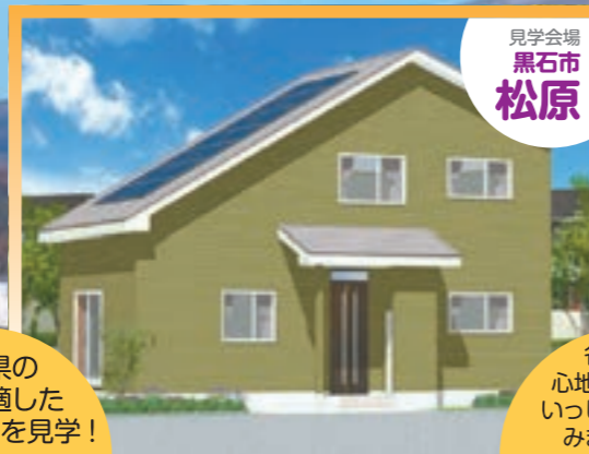
見学会場 黒石市 松原