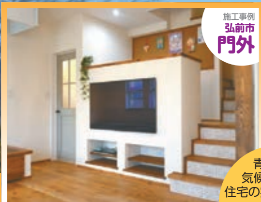
施工事例 弘前市 門外

建物躯体とエネルギー設備機器をセットとして捉え、トータルとしての省エネルギー性能の優れた住宅を表彰する「ハウス・オブ・ザ・イヤー・イン・エナジー2015」に、eco住研ひろさき加盟の全5社が選ばれました！