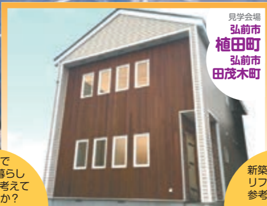
見学会場 弘前市 植田町 弘前市 田茂木町