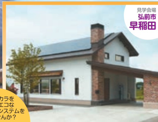
見学会場 弘前市 早稲田